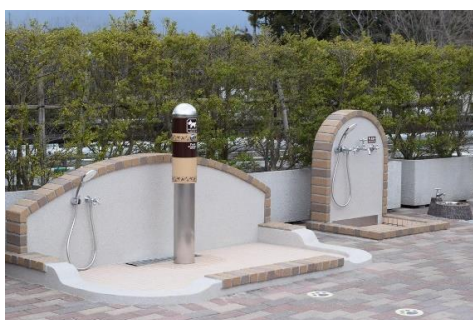
ペット向け衛生設備

Enjoy Shopping with Pets 特設ページ: https://www.premiumoutlets.co.jp/gotemba/pet/