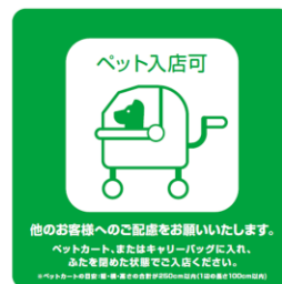
同伴入店可能店舗